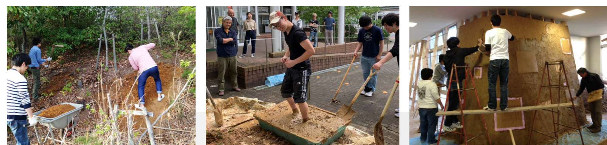
土をつかった大学内でのプロジェクト